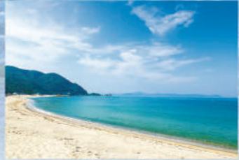
水晶浜海水浴場 水晶のようにきらめく白い砂浜が魅力。透明度が高く、海底が見えるほど!