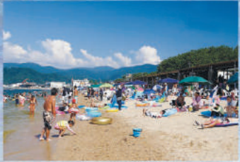
岨比の松原海水浴場 約1.5kmの美しいビーチ。子供向けの設備もあり、ファミリーにも人気。