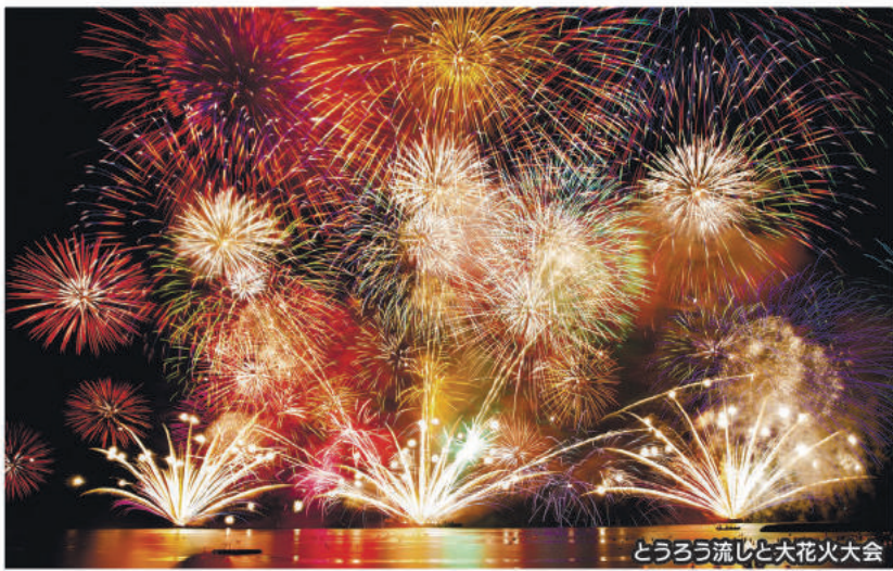
どうろう流じと大花火大会

ふたり乗りのシーカヤックで若狭湾にこぎ出そう。無人浜で海遊びを満喫できる夏休み限定コースも。