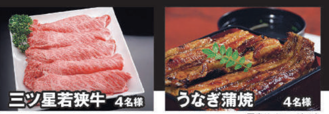
三ツ星若狭牛 4名様 うなぎ蒲焼 4名様